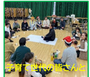
子育て世代の皆さんと