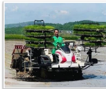
後援会入会は こちらから