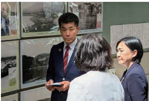
☑ 北方領土の元島民の生の声を聴く