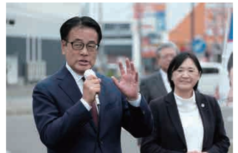
☑ 釧路町で街頭演説する岡田幹事長 釧路市での車座集会 ☑