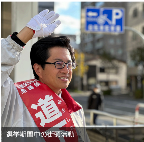
選挙期間中の街頭活動