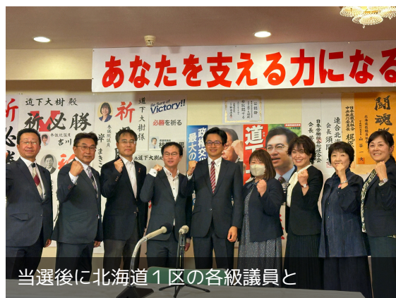
当選後に北海道1区の名級議員と