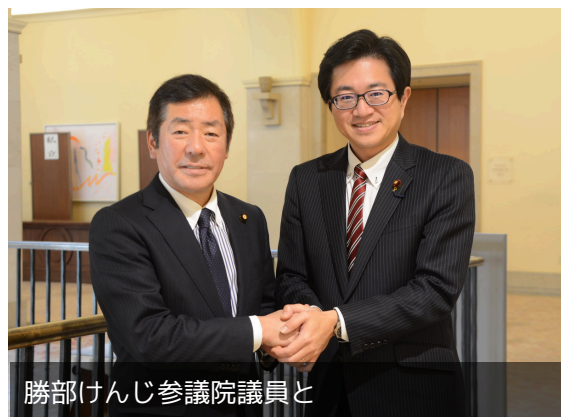
勝部けんじ参議院議員と