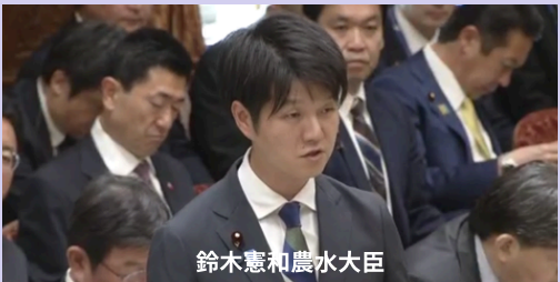
鈴木憲和農水大臣