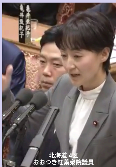
北海道4区 おおつき紅葉衆院議員