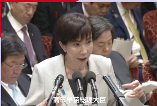
高市早苗総理大臣